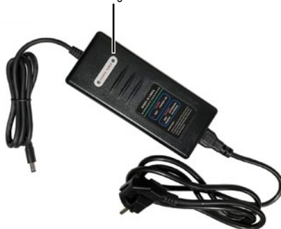
Luces LED del cargador

El cargador de batería de litio suministrado con la bicicleta, se utilizará solo para la batería recargable original. Otros tipos de batería pueden causar lesiones graves o daños irreversibles a la bicicleta.